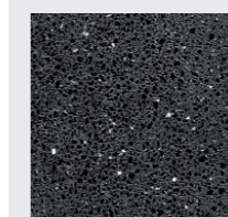
SCHWARZ roh strukturiert oder geschliffen, poliert