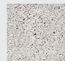
HELLGRAU roh strukturiert oder geschliffen, poliert