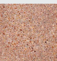
ROSA roh strukturiert oder geschliffen, poliert

«Der T-ONE STONE ist mehr als ein Ofen für mich. Er ist ein Stück klassische Wohnkultur in modernem Design.»