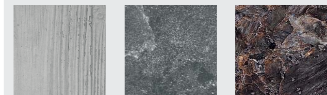
SICHTBETONOPTIK roh strukturiert oder glatt (auf Anfrage)